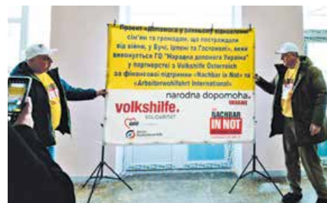
An dieser Schule in Butscha wurde das Dach, das während der Kämpfe stark beschädigt wurde, mit Projektmitteln von ca. € 90.000 komplett erneuert

Mit den Arbeiten wurden lokale Firmen beauftragt. So konnten vor Ort Arbeitsplätze gesichert und die Wirtschaft angekurbelt werden. Dieses Jahr planen wir weitere 730 Wohnungen zu reparieren.