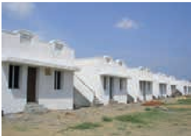
Die fertigen Wohnhäuser in Seruthur

Seit den 1990er Jahren engagiert sich die Volkshilfe insbesondere in der Ostzusammenarbeit mit den Schwerpunkten Arbeitsmarktintegration, soziale Dienstleistungen, Frauenförderung und „Good Governance“. Zwei Highlights aus den letzten zehn Jahren: In Moldau wird seit 2012 die Integration von Menschen mit Behinderungen durch einen inzwischen sehr erfolgreichen sozial-ökonomischen Catering-Betreiber gefördert. Und seit 2014 gibt es mit SEED (Support of Educational and Employment Development in Albania, Kosovo and Serbia) ein Vorzeigeprojekt für regionenübergreifende nachhaltige Entwicklung im Westbalkan in Kooperation mit der Austrian Development Agency.