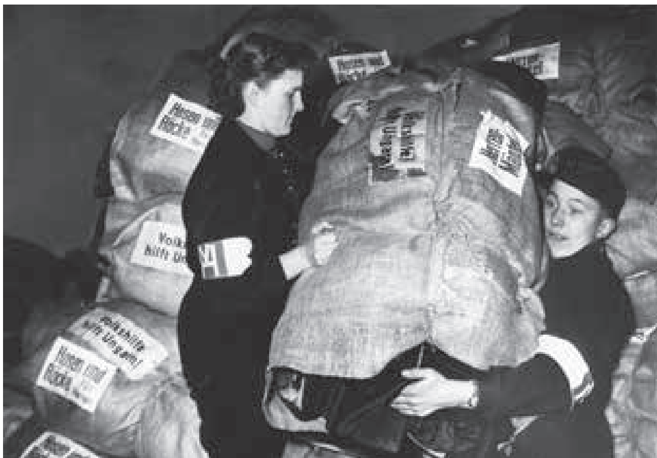
Wiederaufbau in Venzone (Friaul) mit starker Hilfe der Volkshilfe Kärnten

Erdbebenkatastrophe in El Asnam in Algerien. Als Soforthilfe werden tausende Österreich-Pakete, Betten, Decken und Zelte geliefert, eine Schule für gehörgeschädigte Kinder errichtet.