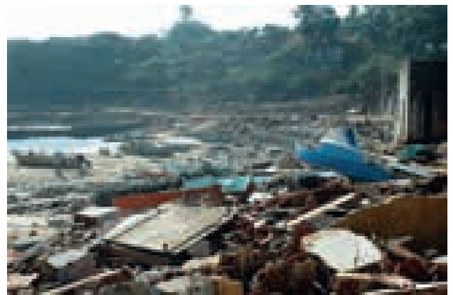
Verwüstungen nach der furchtbaren Tsunami-Katastrophe von 2004 auf Sri Lanka

Unmittelbar nach der Tsunami-Katastrophe 2004 in Südostasien startet die Volkshilfe Österreich einen Spendenaufruf gemeinsam mit der Tageszeitung Kurier. In Südinien wird mit einer indischen Partnerorganisation Soforthilfe geleistet und ein Wiederaufbauprogramm durchgeführt. Das Programm entwickelt sich zum größten Auslandsprojekt in der Geschichte der Volkshilfe, rund 3 Mio. Euro werden von vielen Partnern wie Nachbar in Not, ADA, der voest Belegschaft, OÖ Landesregierung, den Kinderfreunden Wien und Burgenland und vielen anderen aufgebracht. Auch in Sri Lanka und Aceh ist die Volkshilfe Teil eines internationalen Konsortiums, das vor Ort hilft.