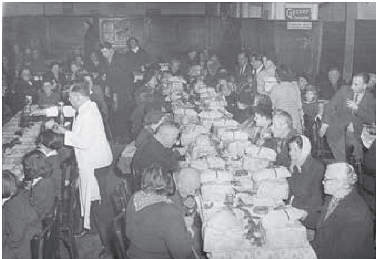
Lebensmittelpakete sichern auch für alten Menschen das Überleben