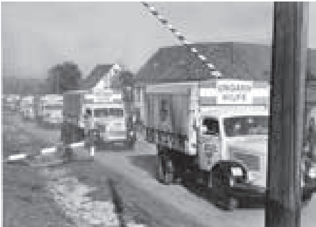
1956: Die Volkshilfe bringt 100 Tonnen Hilfsgüter nach Budapest