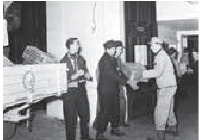
„Volkshilfe hilft Ungarn“-Helfer beim Beladen der Hilfstransporter

Hilfe mit Tradition, denn auch beider „Jahrtausendflut“ in Ostösterreich im Jahr 2002 werden wieder Hochwasseropfer finanziell unterstützt.