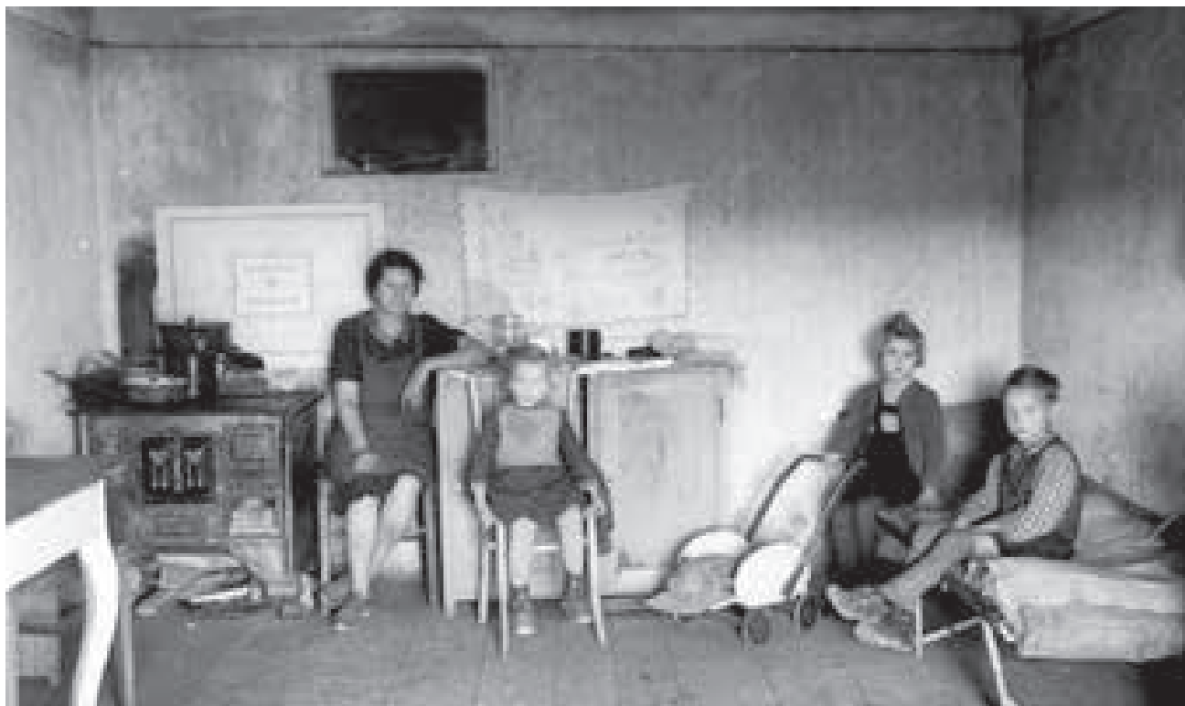
Elendsquartier in der Zwischenkriegszeit

Bereits 1924 arbeitet der Verband „Societas“ mit dem Verein „Distriktkrankenpflege“ zusammen. Das ist der Beginn der häuslichen Pflege durch geschulte PflegerInnen, die heute Hauptaufgabe der Volkshilfe ist.