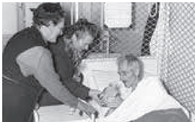
Krankenversorgung startet schon 1924

Nach den fürchterlichen Jahren des Faschismus ist der Krieg im Frühjahr 1945 endlich zu Ende. Die Not der Bevölkerung in den Städten Wiener Neustadt und Wien und in den Industriegebieten in Niederösterreich und der Obersteiermark ist groß. Die Säuglingssterblichkeit betrug im Jahr 1945 37%. Schon bald