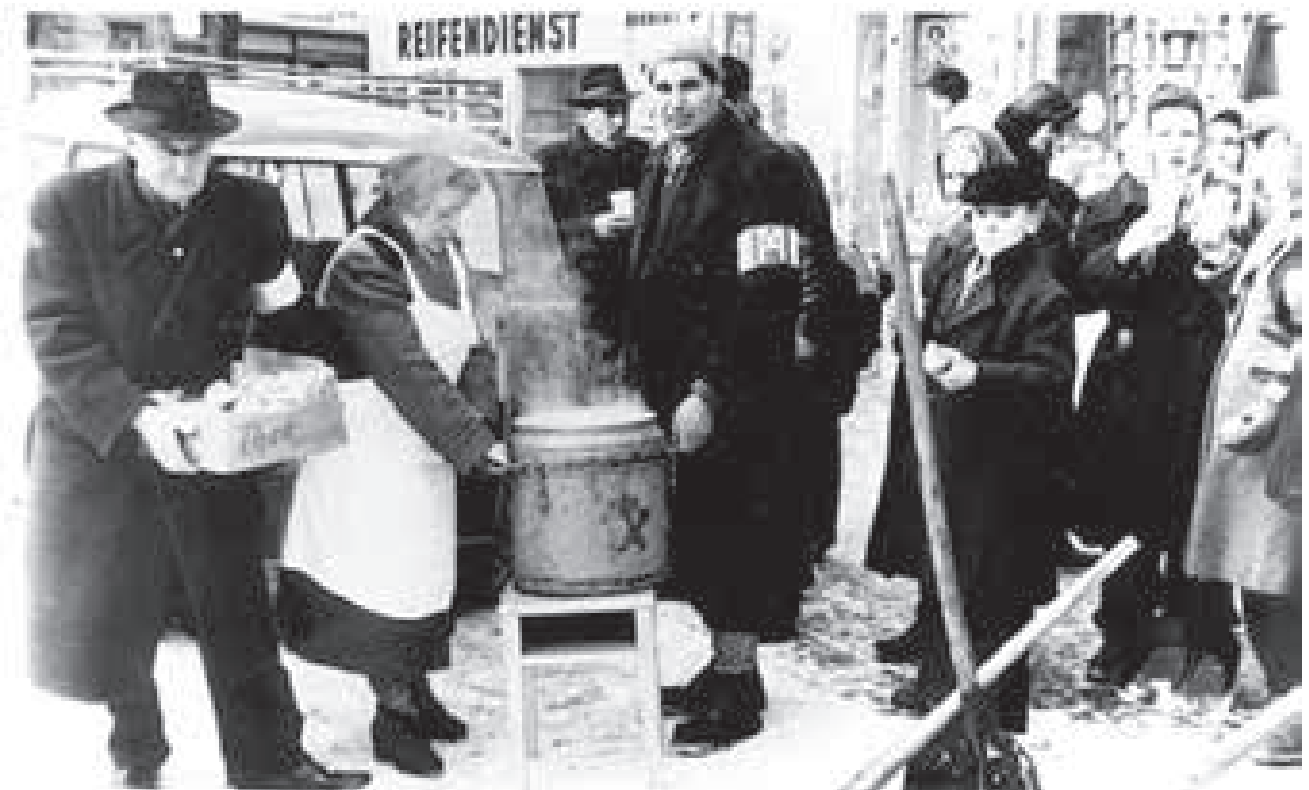
Volkshilfe-Suppenküche im Wien der Zwischenkriegszeit