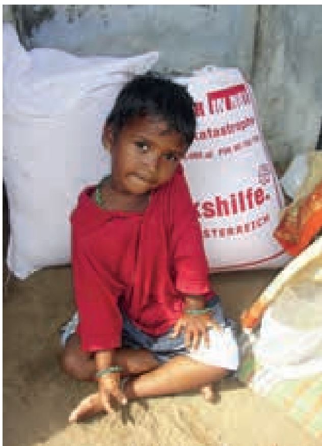
Hilfe für Kinder in Nagapattinam

Seit den 1990er Jahren engagiert sich die Volkshilfe insbesondere in der Ostzusammenarbeit mit den Schwerpunkten Arbeitsmarktintegration, soziale Dienstleistungen, Frauenförderung und „Good Governance“. Zwei Highlights aus den letzten zehn Jahren: In Moldau wird seit 2012 die Integration von Menschen mit Behinderungen durch einen inzwischen sehr erfolgreichen sozial-ökonomischen Catering-Betreiber gefördert. Und seit 2014 gibt es mit SEED (Support of Educational and Employment Development in Albania, Kosovo and Serbia) ein Vorzeigeprojekt für regionenübergreifende nachhaltige Entwicklung im Westbalkan in Kooperation mit der Austrian Development Agency.