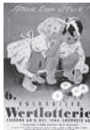
Mit den Erlösen der Volkshilfe-Lotterien wurden unter anderem die Opfer von Naturkatastrophen in Österreich unterstützt

Bereits 1949 wurde ein „Tag der Volkshilfe“ durchgeführt, 500.000 Lotterielose werden um drei Schillinge verkauft. Mit den Erlösen wird beispielsweise den Opfern von Naturkatastrophen in Österreich geholfen.