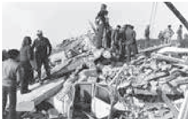
1976: 1.000 Tote nach dem Erdbeben in Friaul

Hilfe für Westsahara. Marokko besetzt die Ex-Kolonie Spanisch-Sahara. Die Saharais leisten Widerstand, bis zum heutigen Tag leben hunderttausende Menschen in Flüchtlingslagern. Die Volkshilfe schickt