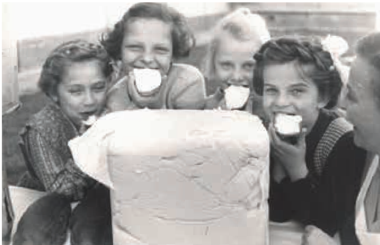
Butterspende in Ybbs 1951