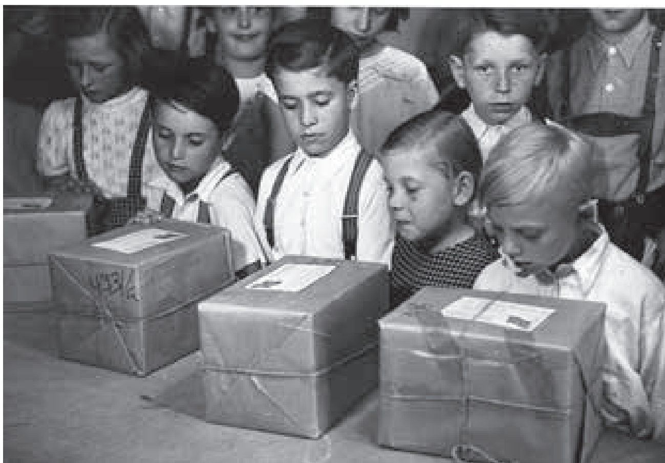
Heiß begehrt: Kinder freuen sich über die Hilfspakete